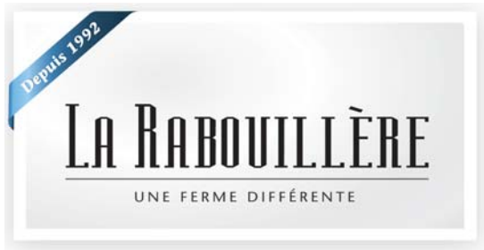
Table champêtre LA RABOUILLÈRE 1073 Rang de l'Égypte, St-Valérien-de-Milton Possibilité de co-voiturage pour ceux qui le désirent